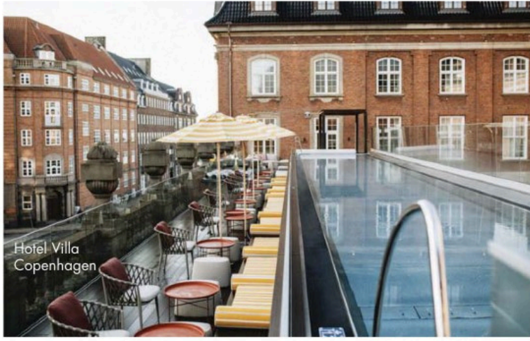
Hotel Villa Copenhagen