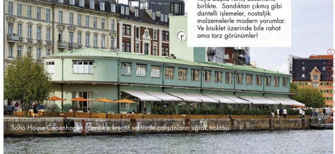
Soho House Copenhagen, özellikle kreatif sektörde çalışanların uğrak noktası.

Son Kopenhag Moda Haftası'nda gözlemlenen sokak stilleri: Leopar desen ama başrolde değil, detay olarak veya başka renk/desenlerle birlikte. Sandıktan çıkmış gibi dantelli işlemeler, nostaljik malzemelerle modern yorumlar. Ve bisiklet üzerinde bile rahat ama tarz görünümler!