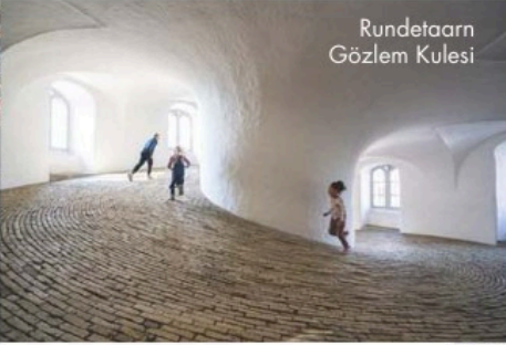
Rundetaarn Gözlem Kulesi